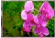
Pois de Senteur